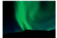
aurora borealis severní polární záře

A natural display of light in the sky – aurora – is typical for polar regions. Auroras are called aurora borealis, or northern lights, in the northern hemisphere, and aurora australis, or southern lights, in the southern hemisphere.